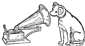
HIS MASTER'S VOICE

La marca en referencia consiste en la representación de un fonógrafo y un perro en actitud de escuchar a la reproducción de la voz de su amo, y las palabras distintivas HIS MASTER'S VOICE, y se aplica en los efectos mismos, en las cajas, envases, otros receptáculos, envolturas, etcétera, de éstos, de manera que se estime conveniente.