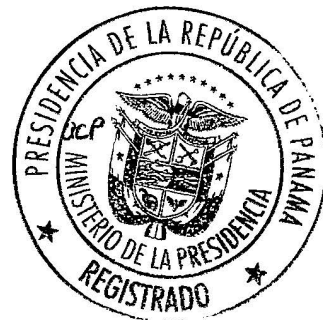
JUAN CARLOS VARELA RODRÍGUEZ Presidente de la República

Dado en la ciudad de Panamá, a los 7 días del mes de Agosto de dos mil diecisiete (2017).